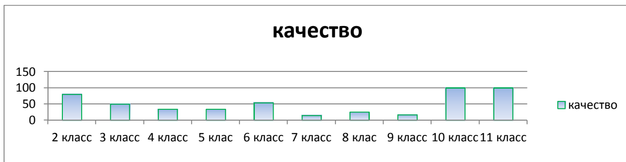
Качественные показатели по предметам за 2020/2021 год