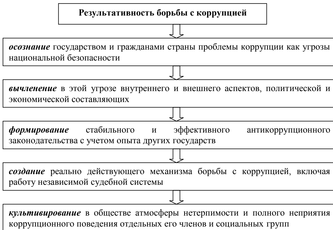
Схема 2. «Цепочка результативности» борьбы с коррупцией

Школьное образование также должно внести свой вклад в создание антикоррупционной атмосферы в обществе, в формирование антикоррупционной устойчивости личности.