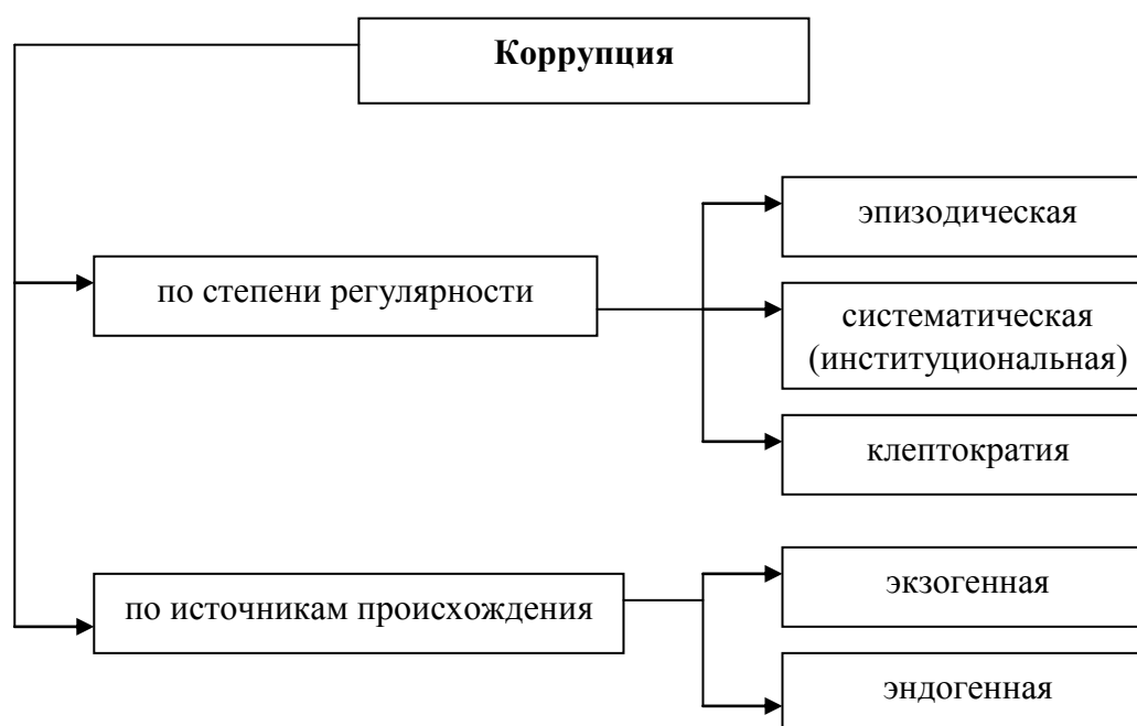
Схема 1. Классификация коррупции

Классификацию коррупции можно представить в виде следующей схемы (см. схему 1 1 ).